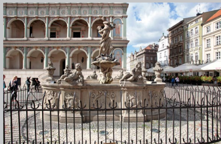
4. Herb na cembrowinie fontanny Prozerpiny na Starym Rynku

Herb umieszczono na ścianie basenu (w otoczeniu płaskorzeźb wyobrażających cztery żywioły) barokowej fontanny. Autorem wykonanej w latach 1758–1766 fontanny z rzeźbą przedstawiającą mitologiczną scenę porwania Prozerpiny przez władcę podziemia był Augustyn Schops.