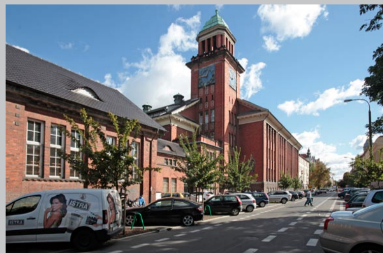
12. Herb na Szkole Podstawowej nr 36 przy ul. Słowackiego 54/56

Herb znajduje się nad bramą wjazdową na dziedziniec szkoły. Pierwotnie była tu strażnica straży pożarnej, która od 1 kwietnia 1900 roku obsługiwała całą zachodnią część miasta. Pozostała po niej tylko wieża zegarowa, wkomponowana w nowy budynek szkoły oddanej do użytku przed I wojną światową. (zdjęcie całego budynku i herbu)