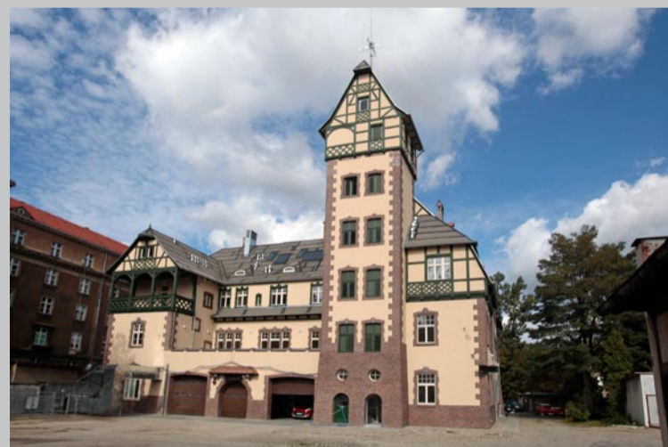
11. Herb na budynku Straży Pożarnej przy ul. Grunwaldzkiej 16a

Herb umieszczono w roku 1908 na nowo otwartej wówczas siedzibie Straży Pożarnej na Jeżycach (przy ówczesnej ul. Augusty Wiktorii). Znajduje się on pomiędzy oknami pierwszego piętra, nad wejściem do budynku. Z ulicy jest słabo widoczny, gdyż budynek strażnicy zastąpiła bryła Szpitala Wojskowego, wybudowanego jako Hotel „Polonia” na Powszechną Wystawę Krajową (PeWuKę) w 1929 roku.