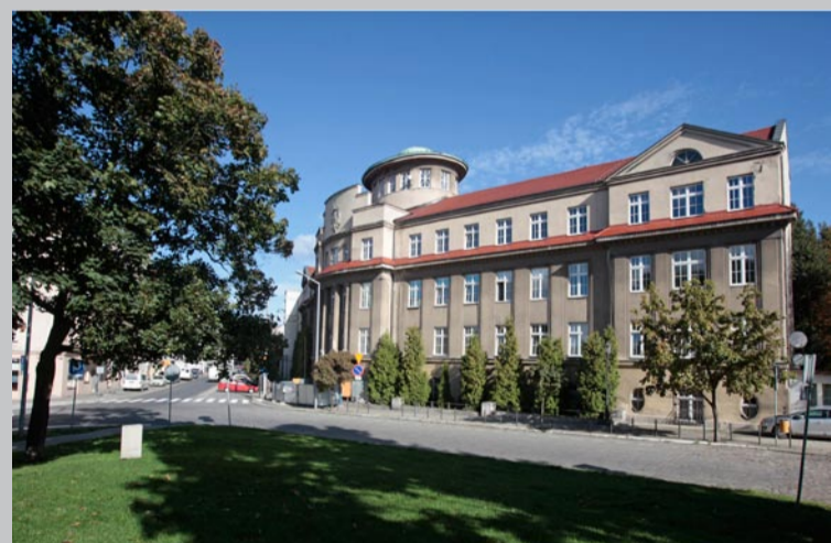
1. Herb na budynku administracji gazowni przy ul. Grobla 15