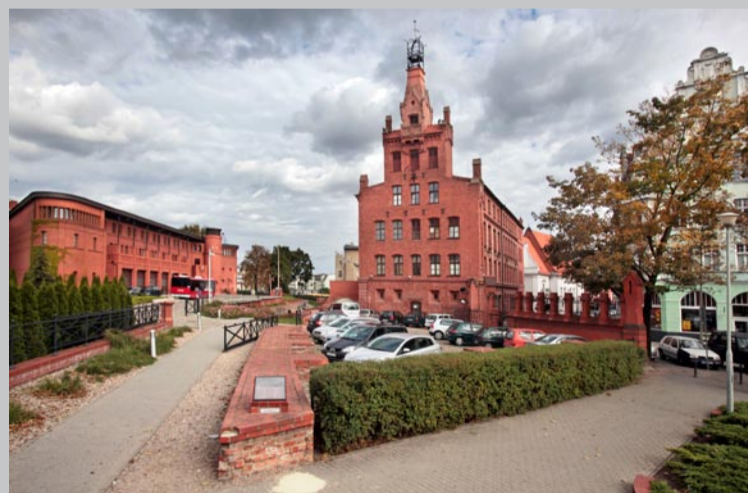
7. Herb na budynku Straży Pożarnej przy ulicy ul. Masztalarskiej 3

Herb umieszczono pod wieżą (na południowej stronie) neogotyckiej strażnicy wybudowanej w latach 1886–1887 dla Zawodowej Straży Pożarnej w Poznaniu, która powstała w naszym mieście w grudniu 1877 roku.