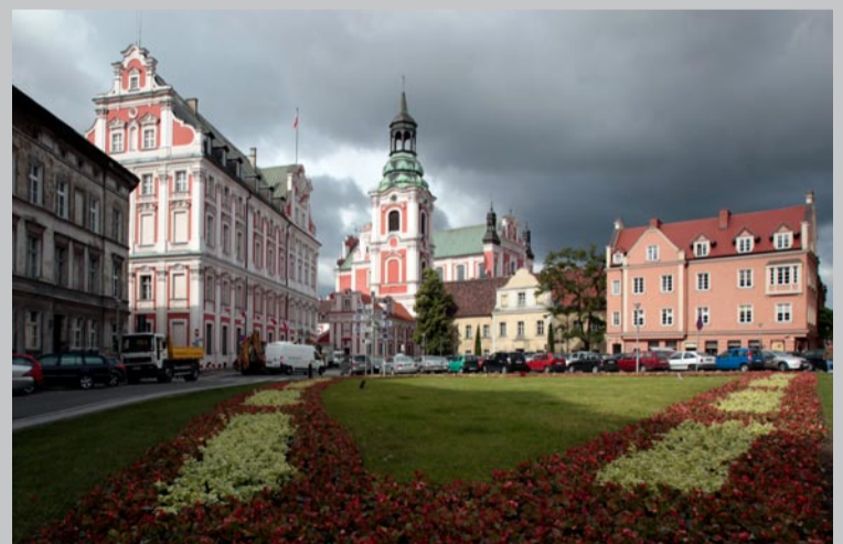
3. Herb na Urzędzie Miasta przy placu Kolegiackim 17