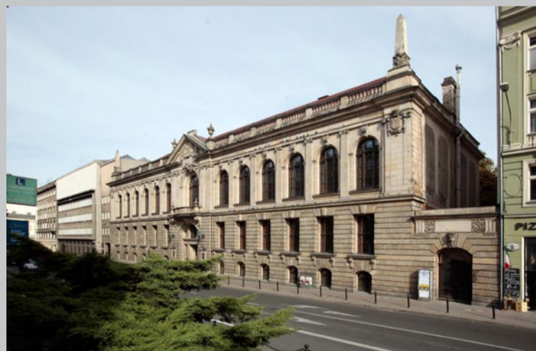
10. Herb na budynku Biblioteki Uniwersyteckiej przy ul. F. Ratajczaka 38/40

Herb umieszczono na zachodniej ścianie (po prawej stronie) w górnej części nad oknami drugiego piętra gmachu, wybudowanego w latach 1899–1902 w stylu późnego renesansu dla Kaiser Wilhelm Bibliothek. Autorem projektu budowli był niemiecki architekt Carl Hinckeloy.